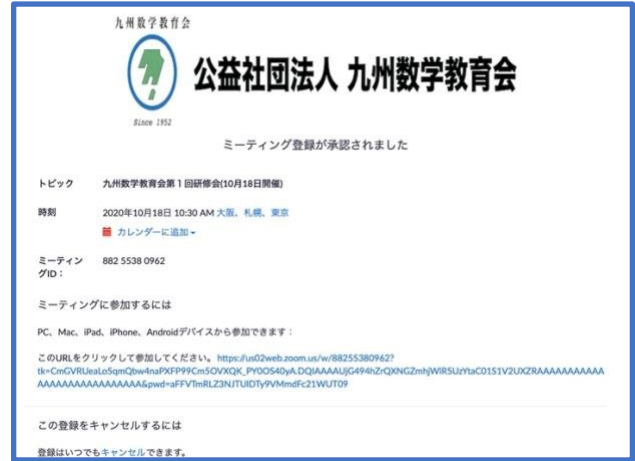
図 2: 登録終了画面, 同様の内容が登録メール