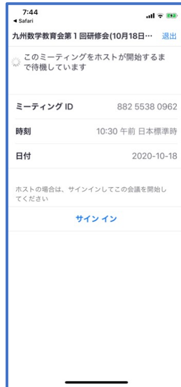
図 4: 会議室接続画面 (iPhone)