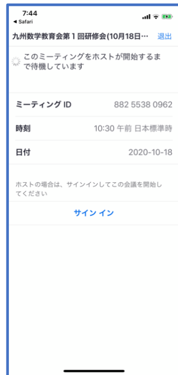
図 4: 会議室接続画面 (iPhone) ホストが会議室準備前は上記の画面になります。