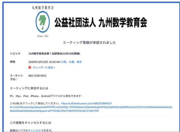
図 2: 登録終了画面, 同様の内容が登録メールアドレスにもメールで届きます。