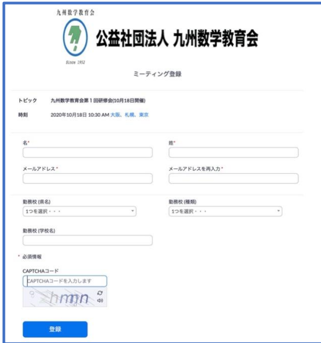
図 1: 電子メール登録開始画面 「名」、「姓」、「メールアドレス」は入力必須です。